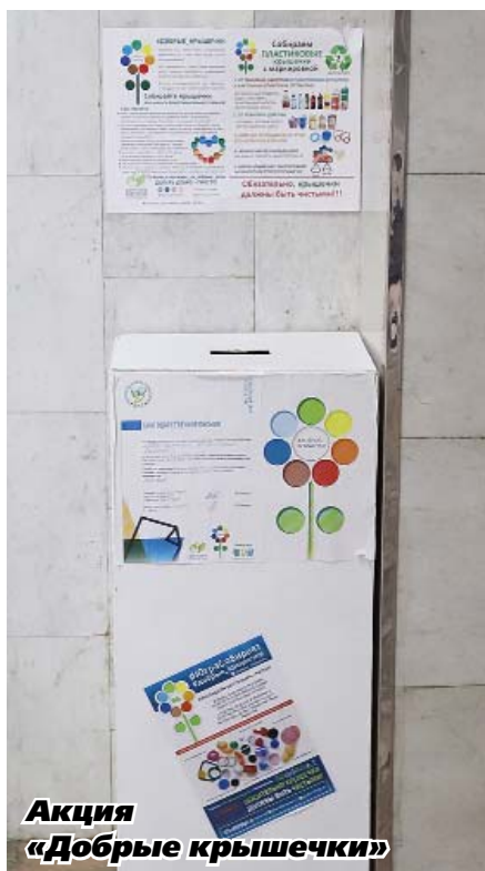
Акция «Добрые крышечки»