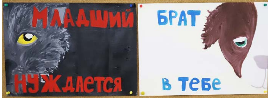
Акция по сбору корма бездомным животным

В сентябре проводилась интересная акция, которая помогала ученикам правильно ставить ударения в словах. На уроках технологии гимназисты рисовали плакаты со словами, в которых люди чаще всего делают